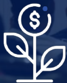
فن سرمایه Fan Fund