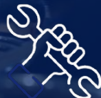
فن ورک Fan Work