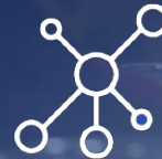
فن نت Fan Net