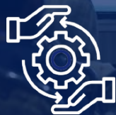
فن حکمرانی Fan governance