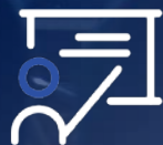
فن پیچ Fan Pitch